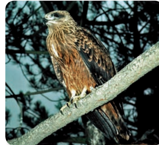
El mecanismo de vuelo de las aves planeadoras consiste en aprovechar las corrientes de aire ascendente para tomar altura y planear con un gasto energético mínimo. La ausencia de estas corrientes en el mar les obliga a buscar los pasos más estrechos entre el continente europeo y el africano: el de Gibraltar y el del Bósforo. La espera de condiciones favorables para la travesía llega a reunir en esta zona gran número de aves, llegándose a contabilizar hasta tres mil milanos negros en un sólo día (como el ejemplar joven de la fotografía).