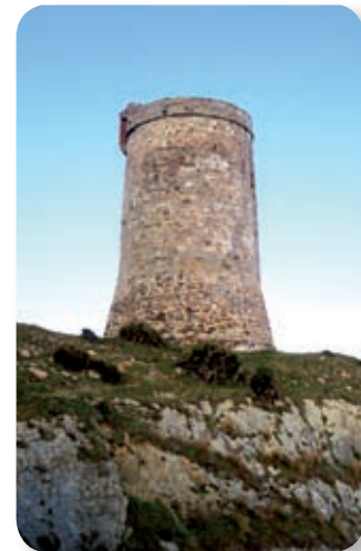
La torre de Guadalmesí tuvo como misión la defensa del único punto de abastecimiento posible de agua que se mantenía durante todo el año.

La zona que recorreremos [3] es cazadero frecuentado por rapaces y paso obligado en las rutas migratorias de aves, lo que permite la observación de muchas de ellas, como el milano real, especie residente, considerada entre las más elegante de cuantas habitan en la península por su fascinante y acrobático vuelo.